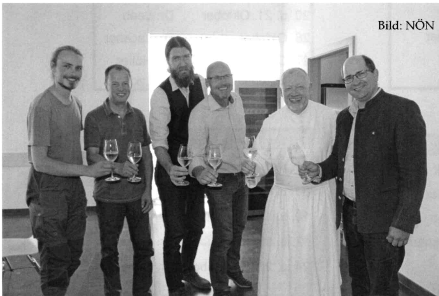
Im Bild: von links nach rechts:

Ein wichtiger Faktor dabei wird sein, das Bewusstsein aller dahingehend zu bilden , dass auch das kleine „wilde“ Eck im Garten oder die naturbelassene „Gstätt“ einen wichtigen Beitrag für die Erhaltung der artenreichen Fauna und Flora darstellt.