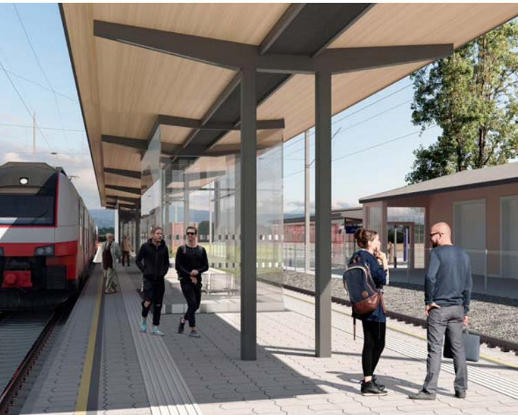
Der Bahnhof Zellerndorf (auch am Titelbild) wird barrierefrei und modern.